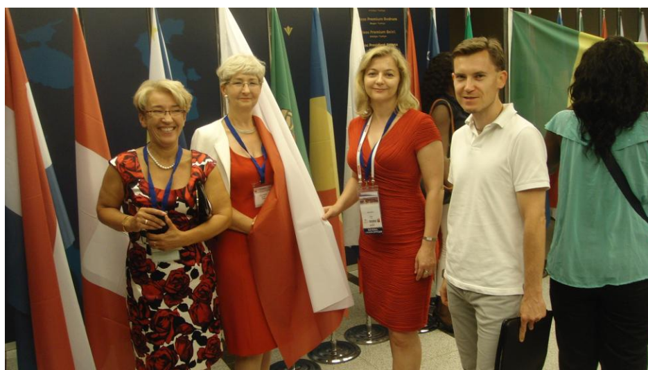
Delegacja NIL na Światowy Parlament Stomatologiczny FDI w Stambule.