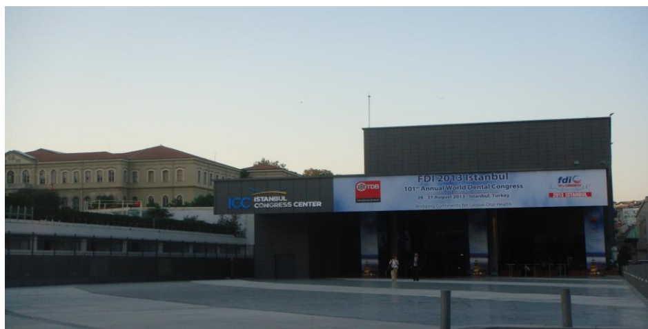
Wejście do centrum kongresowego w Stambule.

Miejscem obrad Parlamentu oraz Kongresu było centrum kongresowe Istanbul Convention Centre.